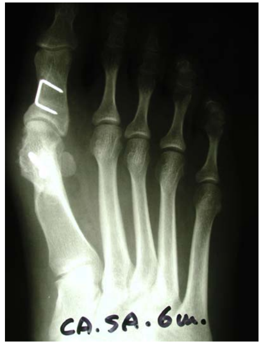
Osteotomia di traslazione mediale del calcagno e contemporanea correzione dell'alluce